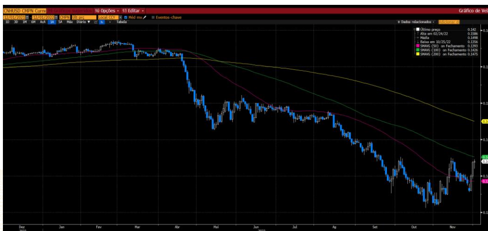
Mesmo com os dados de uma balança comercial ruim, o mercado mantém uma expectativa de retomada.