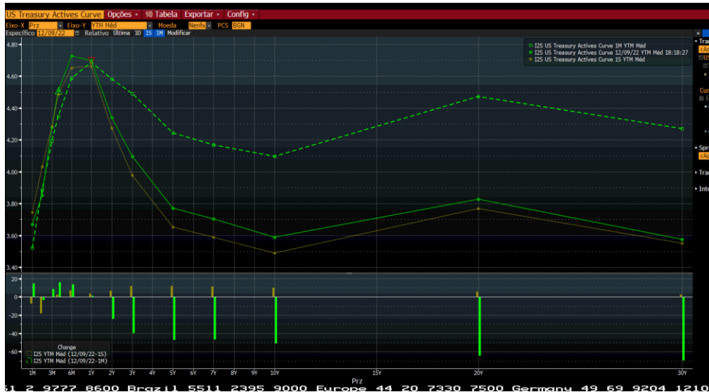
Pontilhado 30 dias; Dourada 1 semana; Verde a mais recente

Precisamos acompanhar no detalhe essa persistência dos dados de inflação americana, pois estamos vendo um Fed com a seguinte intenção: altas menores por mais tempo, porém a inflação está persistente, isso bate na renda disponível (perda do poder de compra).