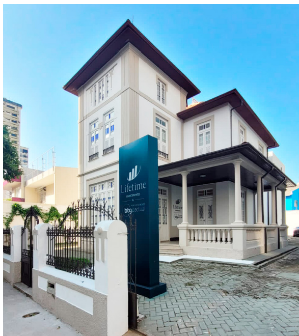
Sede da Lifetime Investimentos em Belém-PA