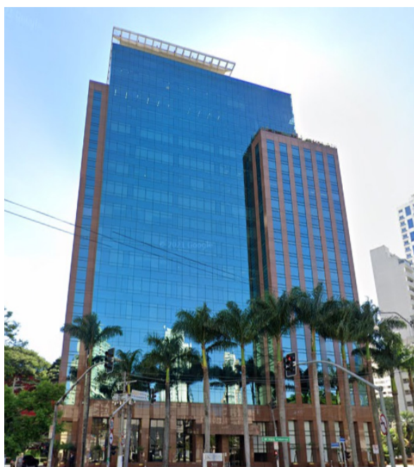
Matriz da Lifetime Investimentos em São Paulo

Melhor escritório do BTG Pactual no Pra Vida Toda em 2024