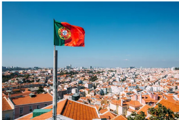
Entre as opções europeias, Portugal permanece como um dos destinos mais atrativos

Além do Golden Visa, Portugal também oferece um regime fiscal atrativo para estrangeiros: o Estatuto de Residente Não Habitual (RNH) que proporciona benefícios tributários.