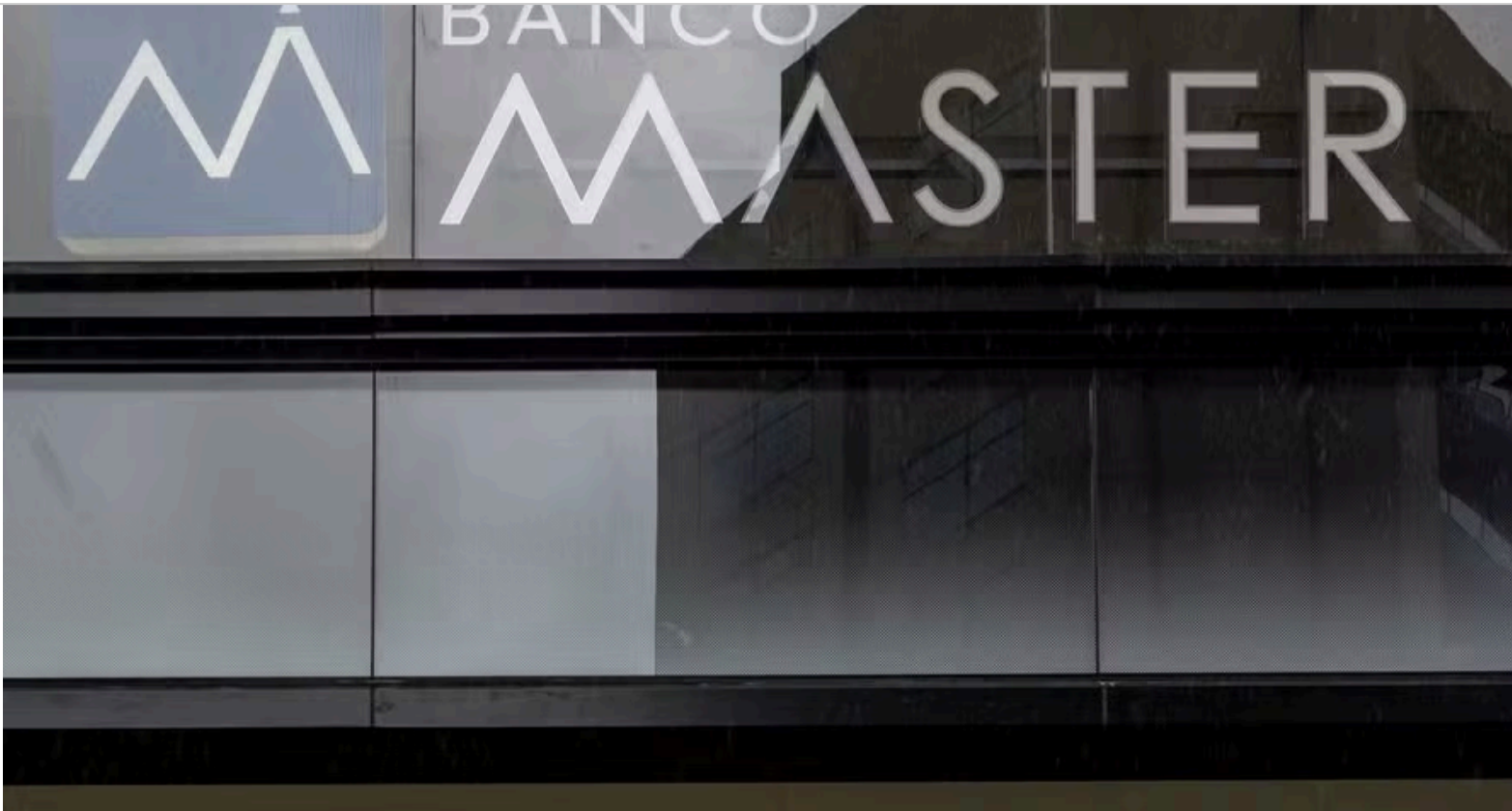
Fachada da sede do Banco Master, em São Paulo

Os mais de R$ 40 bilhões que começam a ser desembolsados pelo Fundo Garantidor de Créditos (FGC) para ressarcir investidores de Certificados de Depósitos Bancários (CDBs) do Banco Master, após a liquidação extrajudicial da instituição, trouxeram uma liquidez extra e fora de época para o mercado de investimentos. Assessorias que fazem o relacionamento diretamente com o cliente estão em campanha para reter esses recursos, mas é muito dinheiro numa tirada só para absorver de uma vez.